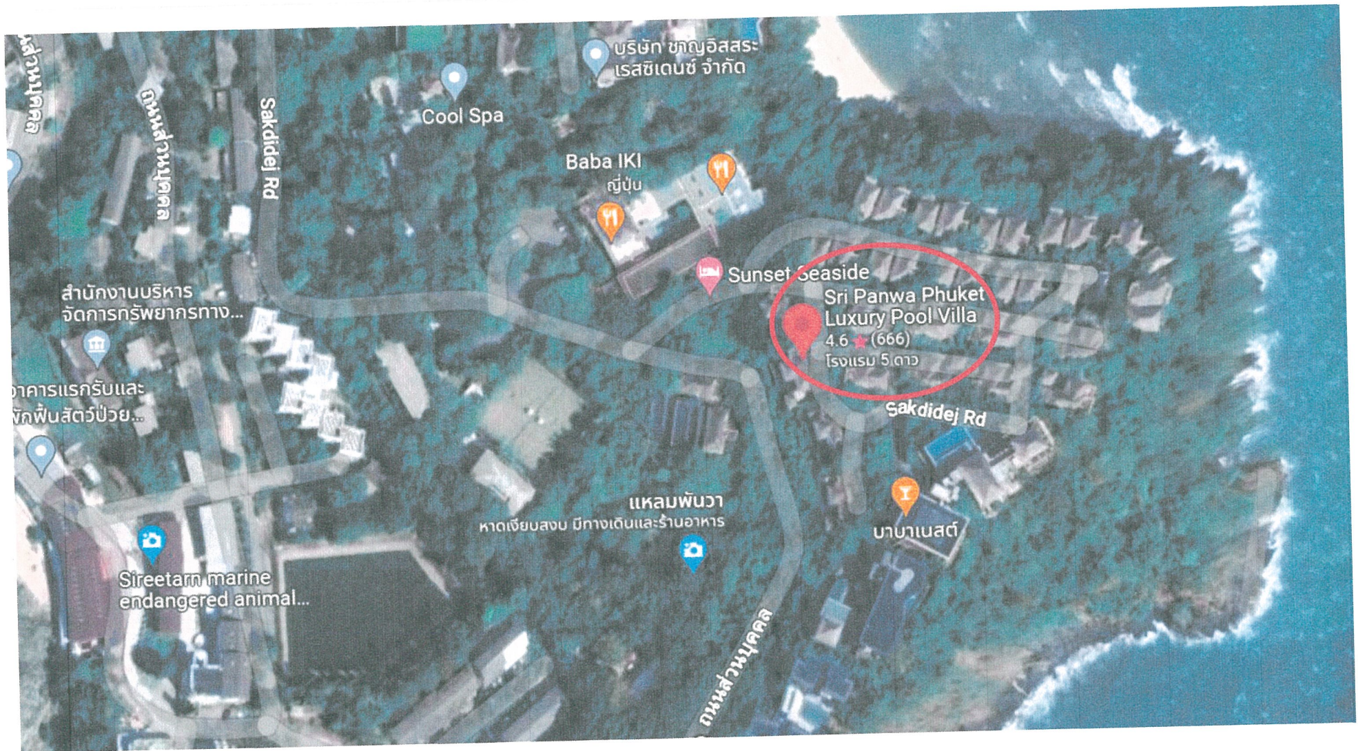
รูปภาพที่ 1.1 แผนที่ตั้งของโครงการ โรงแรม ศรีพันวา บูทีค รีสอร์ท แอนด์ สปา (Top view)

รายงานผลการปฏิบัติตามมาตรการป้องกันและแก้ไขผลกระทบสิ่งแวดล้อมและมาตรการติดตามตรวจสอบคุณภาพสิ่งแวดล้อม โครงการ โรงแรม ศรีพันวา บูทีค รีสอร์ท แอนด์ สปา ระยะดำเนินการ ระหว่างเดือน มกราคม - มิถุนายน 2566